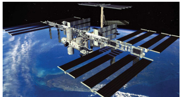
国際宇宙ステーション 地上から約354キロの高さで現在も建設が続く

超高速「ハイパーチューブ」計画、ロスからサンフランシスコまで わずか30分 約661km