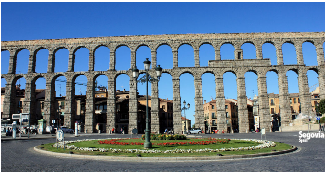
セゴビアの水道橋(スペイン・セゴビア) 1世紀に作られた水道橋